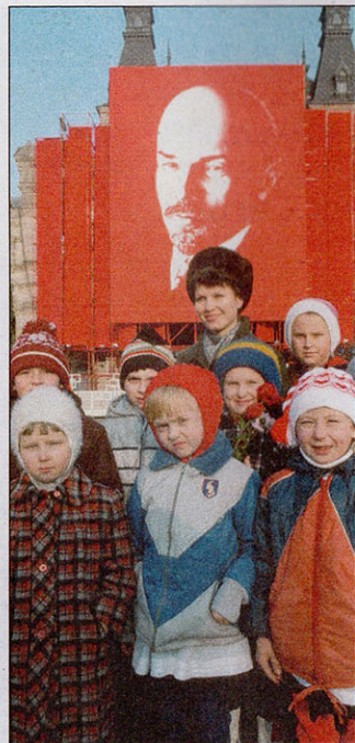
6 Stad: Moskou & Sint Petersburg, 1988 'Ik keek daar gewoon naar het verleden: overal rode vlaggen, mensen die rondliepen in kleren uit de jaren dertig, overal soldaten op straat.'

► kunst is ontstaan na 1900, en alles daarvoor niet meer was dan duur behang. Hoewel er een kern van waarheid in zit – bijna alle kunst werd vroeger in opdracht gemaakt, en diende vooral om er een kasteel of patriciërshuis mee op te smukken – heb ik er ook spijt van dat ik het heb gezegd. Want al die grote schilders als Jan van Eyck en Jeroen Bosch en Francisco Goya werkten weliswaar in opdracht, maar ze slaagden er toch in, al was het soms minimaal, om die opdrachtgever in zijn blootje te zetten. Ik vind het dapper dat ze het durfden, want de macht was destijds veel sterker dan nu. Je kon vermoord worden om een schilderij.