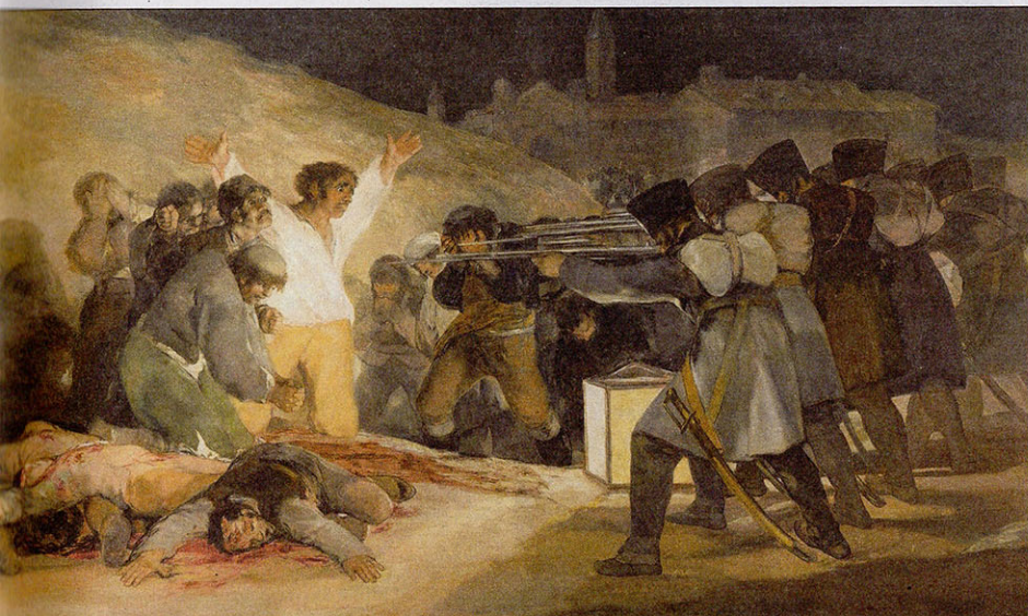
5 Beeldende kunst: El tres de mayo de 1808 en Madrid , Francisco Goya 'Dit is eigenlijk de eerste vorm van fotojournalistiek. Tegenwoordig win je met zo'n tableau de World Press Photo.'