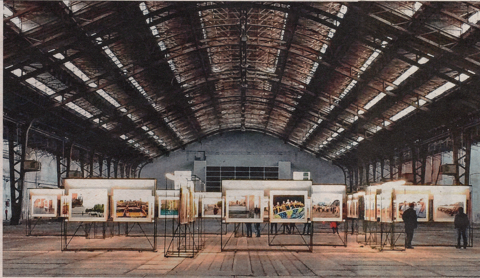
'D.P.R. Korea grand tour' van Carl De Keyzer in de vervallen Floraliënhel in Gent.