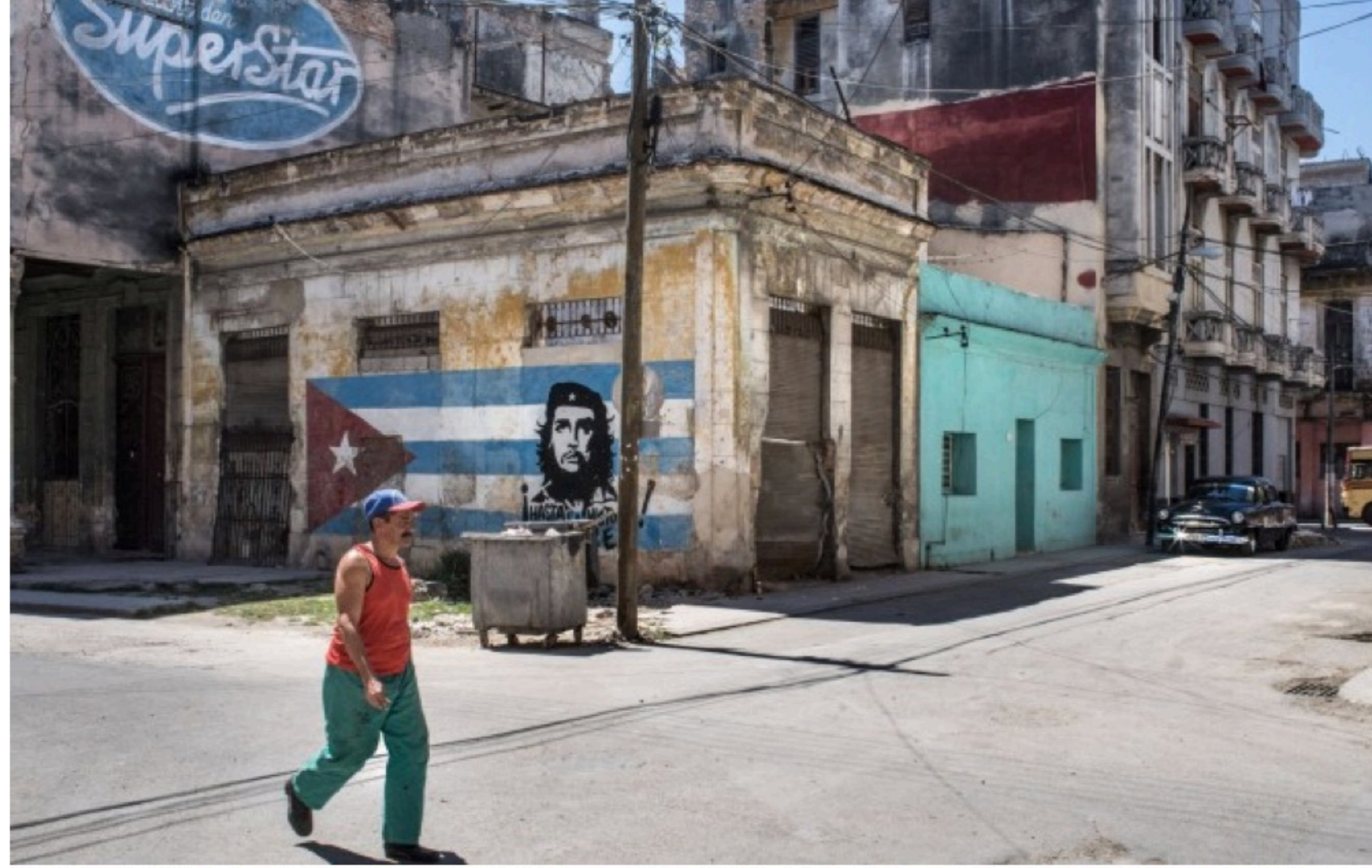
DE KEYZER, Havana, Cuba, 2015, archival pigment print on fine art paper mounted on Dibond, 109 x 130 cm