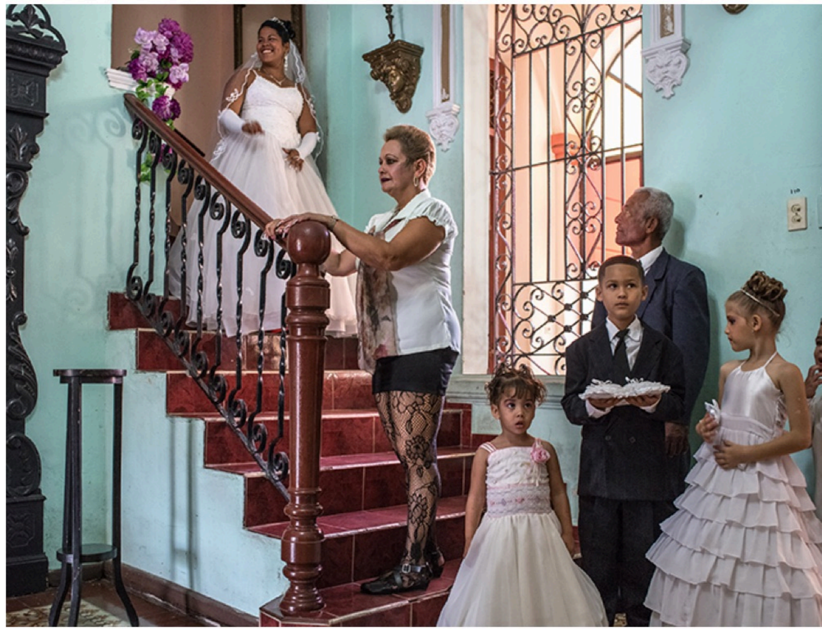
DE KEYZER, From the series Cuba, la lucha , 2015, archival pigment print on fine art paper mounted on DBond, 109 x 130 cm

Carl De Keyzer is sinds 1994 lid van het wereldberoemde fotoagentschap Magnum Photos , gesticht door o.a. Henri Cartier-Bresson. Dat zijn werk de moeite waard is, hoeft dus weinig betoog. Maar laten we het over Cuba hebben!