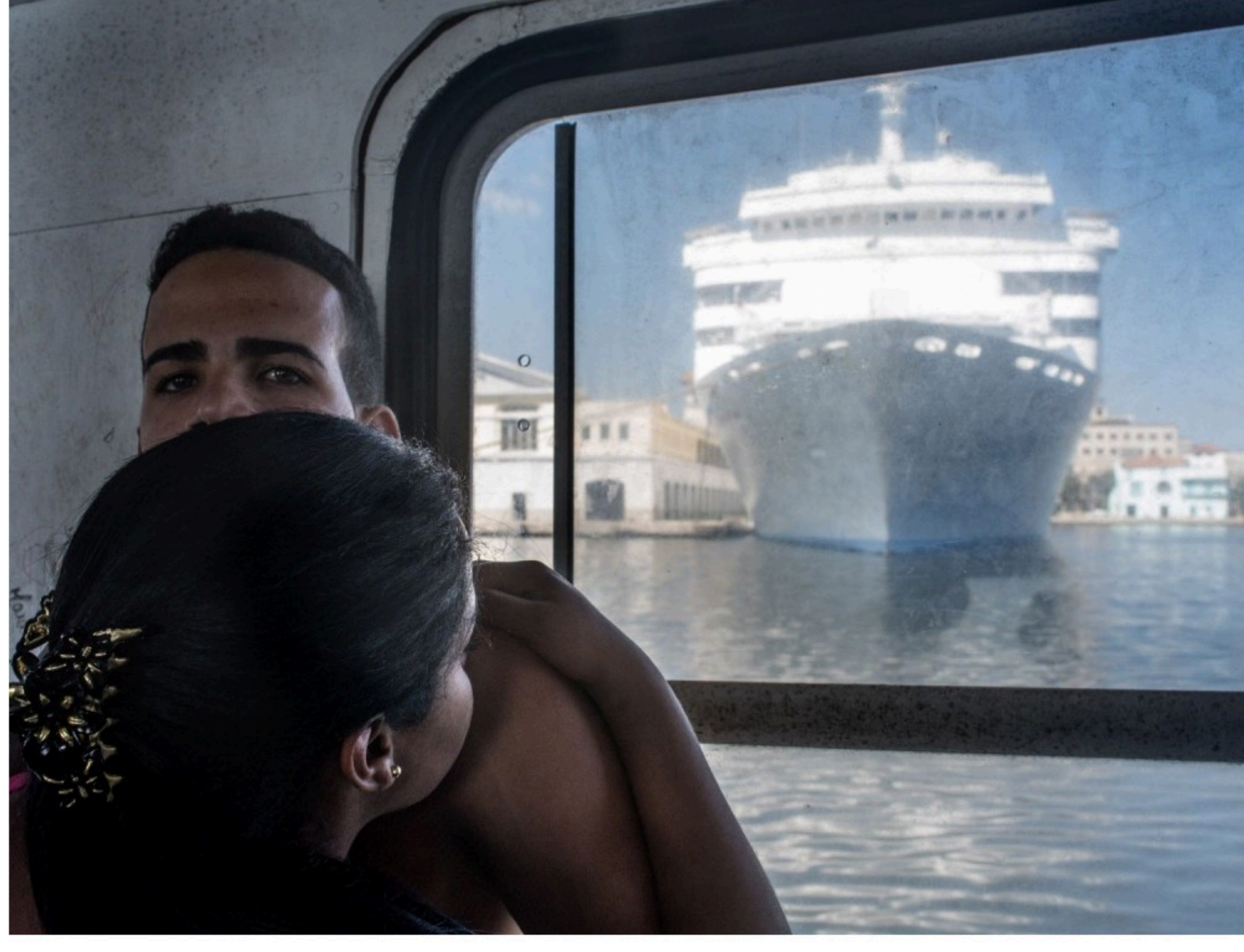
DE KEYZER, Havana, Cuba, 2015, archival pigment print on fine art paper mounted on Dibond, 109 x 130 cm, © Carl De Keyzer, Courtesy Roberto Polo, Brussels