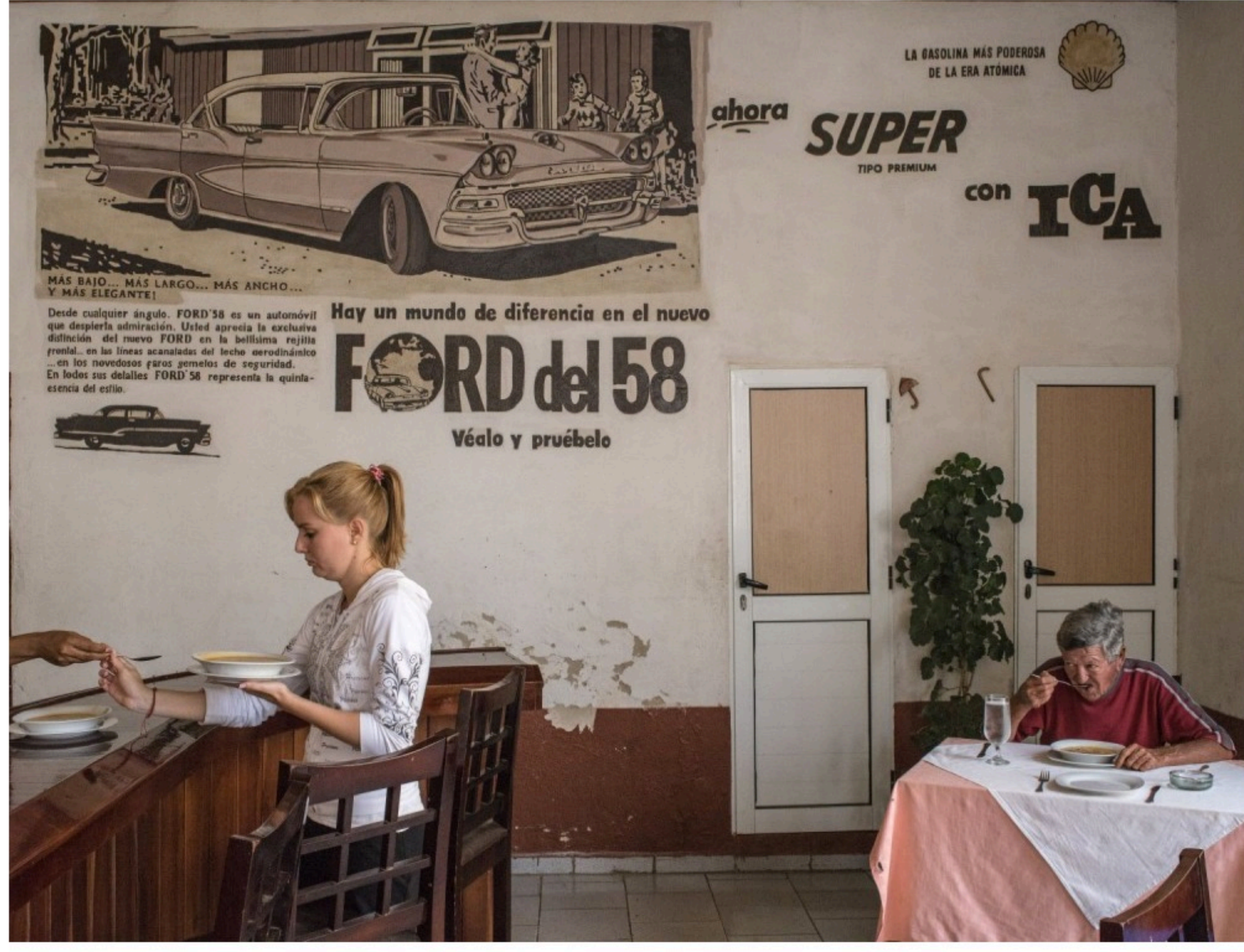
DE KEYZER, Remedios, Cuba, 2015, archival pigment print on fine art paper mounted on Dibond, 109 x 130 cm, © Carl De Keyzer, Courtesy Roberto Polo, Brussels

De fotoreeks is heel uitgebreid met meer dan 60 werken. Zelf ben ik serieus geschrokken toen ik ontdekte hoe groot de Roberto Polo Gallery is! Het is bijna een museum op zich, maar dan gratis. De catalogus is te koop voor €49,99 en is met zijn 176 pagina's absoluut een meerwaarde in je boekenkast, al ben ik zelf nog even aan het sparen.