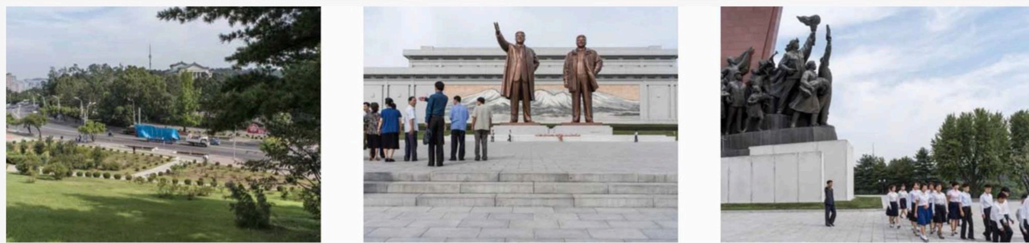
Deel van een leporello uit het boek. Foto's Carl De Keyzer

Aan de foto's is dat te zien. Althans, als Noord-Korea er werkelijk zo uit ziet zoals dit fotoboek het toont, kan alleen maar worden beaamd dat het een modelland is. Niet het soort ideaal waarin je zou willen wonen, maar wel een land waarin alles keurig is geregeld, iedereen verzorgd en waar geen vuiltje aan de lucht is, laat staan op straat. Dat op zichzelf maakt de foto's van De Keyzer al opmerkelijk, want de foto's in het boek wekken vaak de indruk kiekjes te zijn waarop de fotograaf zich niet echt heeft uitgesloofd om er iets moois van te maken. Wie deze beelden contrasteert met de evenzogoed gekleurde informatie die de internationale nieuwsmedia over Noord-Korea geven, zal met nog meer vragen achterblijven. Hoe is het echt om Noordkorea te zijn? Niet prettig, lijkt het, want of nu de horrorverhalen uit het nieuws waar zijn of het ideaalbeeld dat de gidsen van De Keyzer ons tonen, gezellig gaat het er zelden toe.