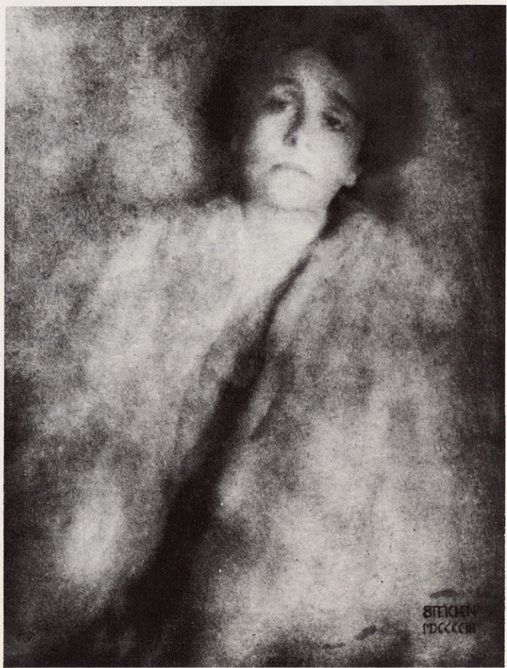
HISTORISCHE PROCÉDÉS, Henk Van De Kerckhove Foto Edward Steichen