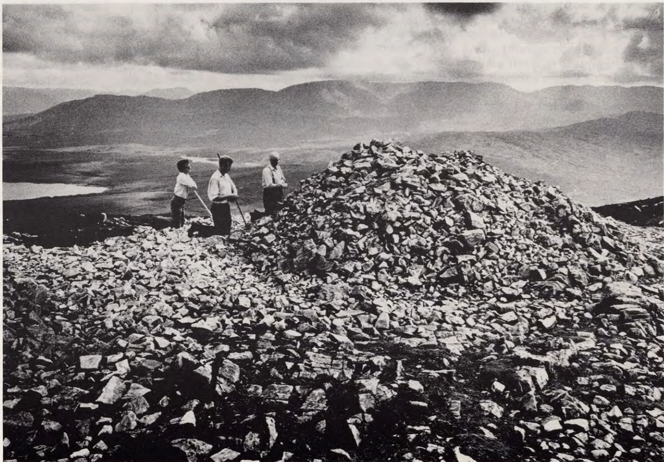
Croagh Patrick, Ireland