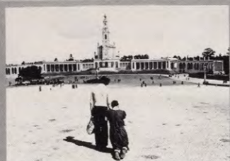
de grote boetebedevaarten in europa