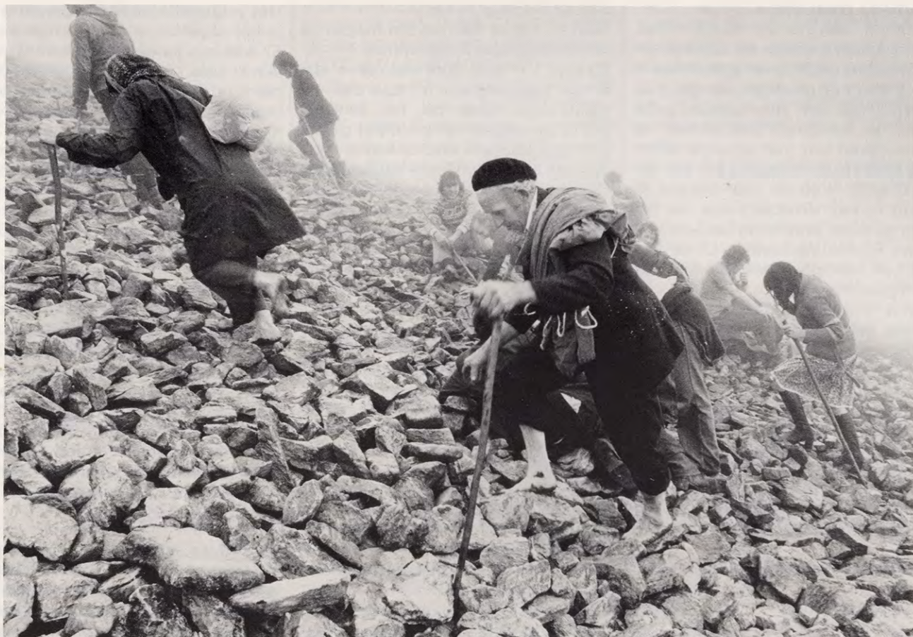
Croagh Patrick, Ireland