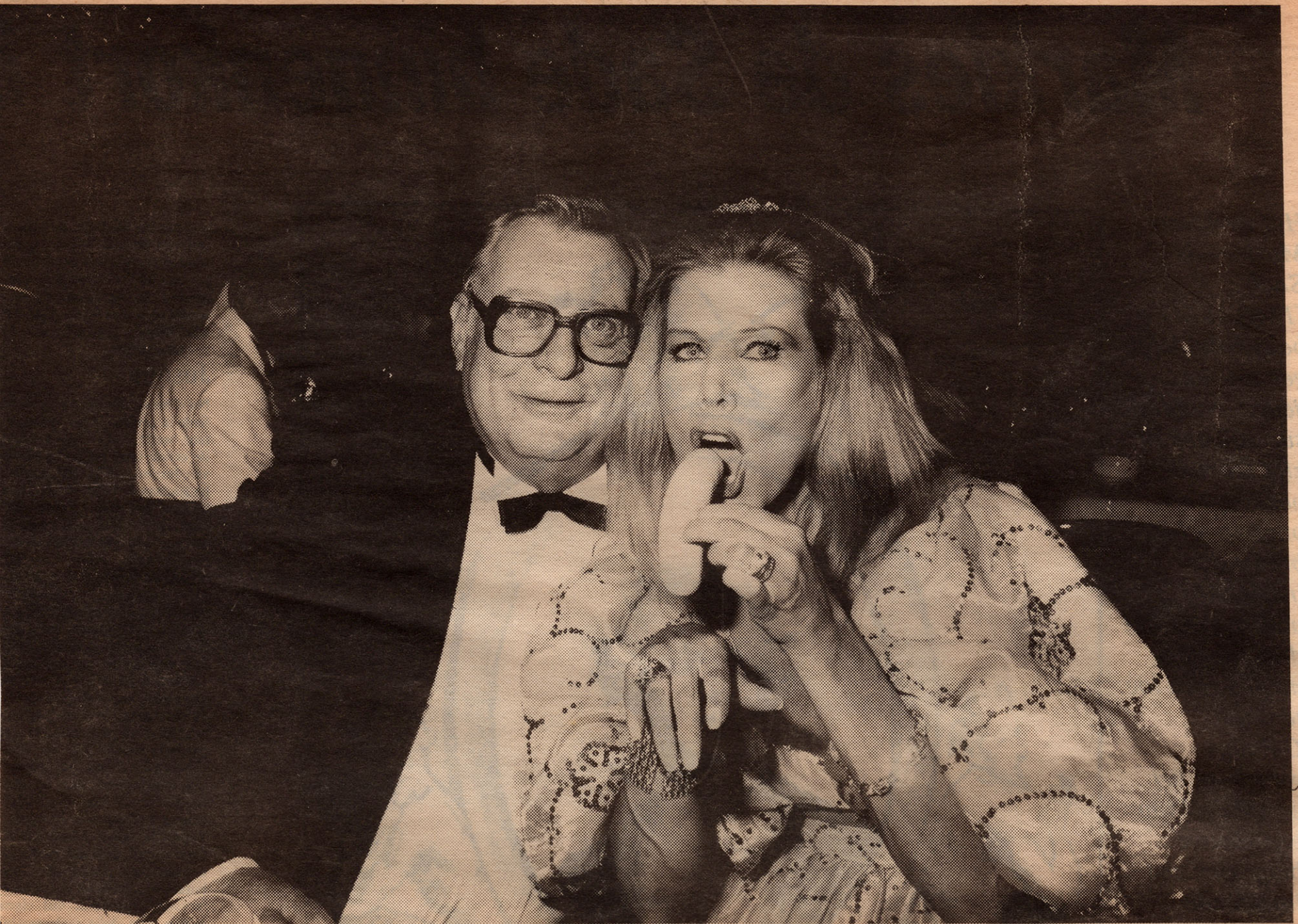
De Duitse Upper Class in onbewaakte momenten, Hun namen doen er eigenlijk weinig toe, al is het soms leuk om zoals hieronder (de grote reizende Neckermann) en op onze 'Affiche'-pagina (Kohl) te weten wie hier precies de pet en de pret uitbeeldt.